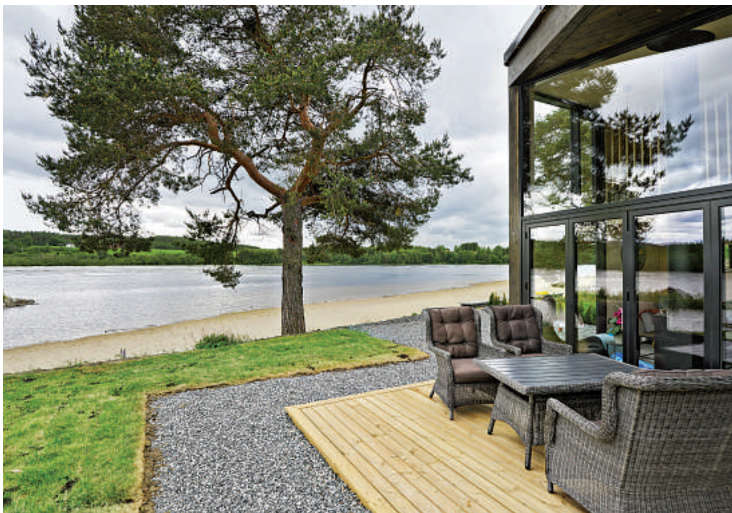
FOLKSOMT: I en årrekke har denne stranden vært et populært utfartssted for de fastboende i området. I sommer vil de få selskap fra hyttefolket fra Nes strandhager.