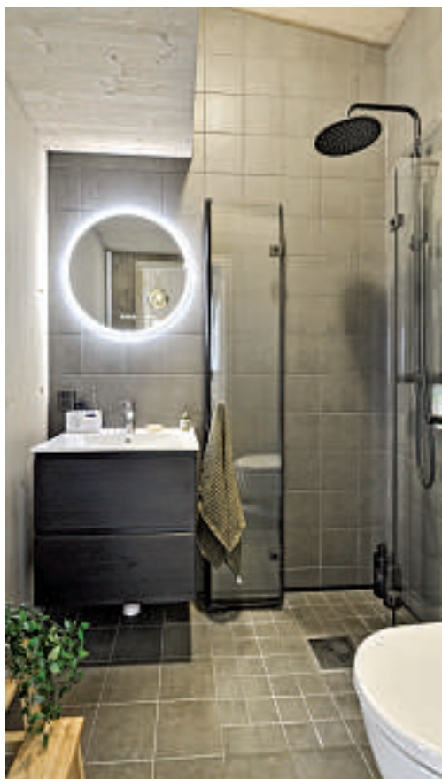
HØYT: På grunn av skråtakene har alle hyttene fått stor takhøyde, noe som også gir en ekstra romfølelse.